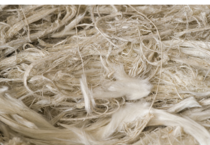
4. ábra – Azbesztrostok