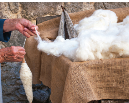
9. ábra – Kézi fonás

A textilszálat (fonal, cérna) a rostok sodrásával nyerik, amely végezhető géppel (8. ábra) és kézzel (9 ábra). A fonal a sodrat iránya szerint lehet: jobbra sodort Z betűvel jelölik és balra sodort S betűvel jelölik.