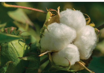
1. ábra – Gyapot toktermése