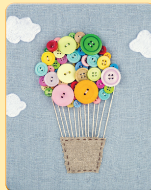
GOMBOKKAL DÍSZÍTETT KÉP