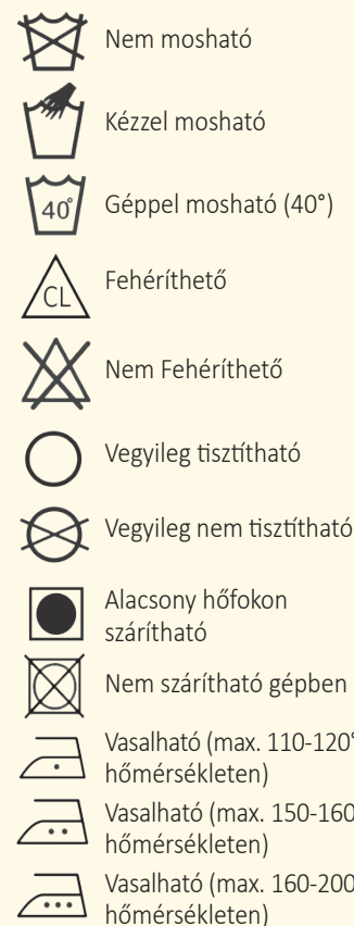
6. ábra – Egyezményes jelek