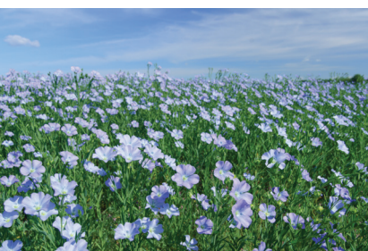
2. ábra – Rostlenkultúra