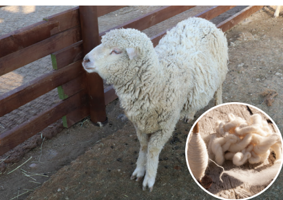
3. ábra – Gyapjú