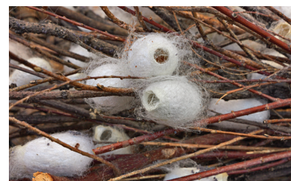
5. ábra – Selyemhernyó gubói