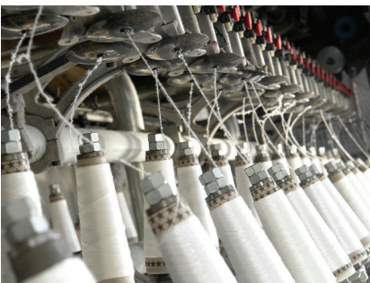
8. ábra – Gépi fonás